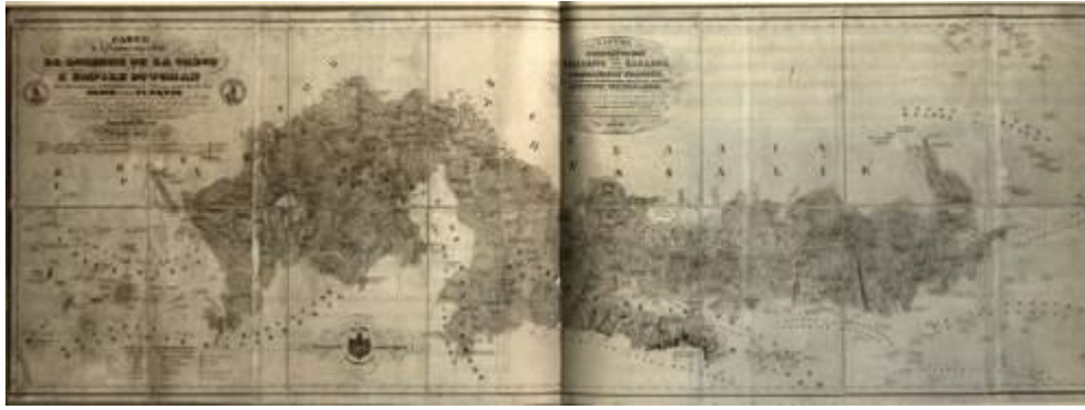
Χάρτης ορίων Ελλάδας - Οθωμανικού κράτους, του 1832 Карта с границами Греции и Османской державы. 1832 г.

Ολοκληρώνοντας μπορούμε να πούμε ότι η δημιουργία ανεξάρτητου ελληνικού κράτους ήταν ένα γεγονός που η σημασία του δεν αφορούσε μόνο τους Έλληνες. Για τους Έλληνες απετέλεσε την επιβράβευση ενός σκληρού και αιματηρού εφτάχρονου αγώνα με πολλές θυσίες, ταυτόχρονα όμως η εθνική επανάσταση ενός λαού με ένδοξο παρελθόν, που επί αιώνες ήταν υπόδουλο, έδινε τη δυνατότητα να εκδηλωθούν τα φιλελεύθερα αισθήματα σε ολόκληρη την Ευρώπη που ζούσε κάτω από την πίεση απολυταρχικών καθεστώτων και αποτελούσε ένα προηγούμενο για τους λαούς που επιζητούσαν την ελευθερία τους, ιδιαίτερα για τους βαλκανικούς λαούς. Παράλληλα, η επανάσταση και η νίκη των Ελλήνων, προκαλώντας την ευνοϊκή επέμβαση των μεγάλων δυνάμεων, ήταν ένα ξεκίνημα για τη διάλυση της Οθωμανικής Αυτοκρατορίας. Ήταν μια διαδικασία που κράτησε σχεδόν έναν αιώνα. Στη διάρκεια αυτού του αιώνα ολόκληρη η περιοχή, η περιοχή μας, ήταν ένα καζάνι που έβραζε από εθνικισμούς και διεθνή συμφέροντα.